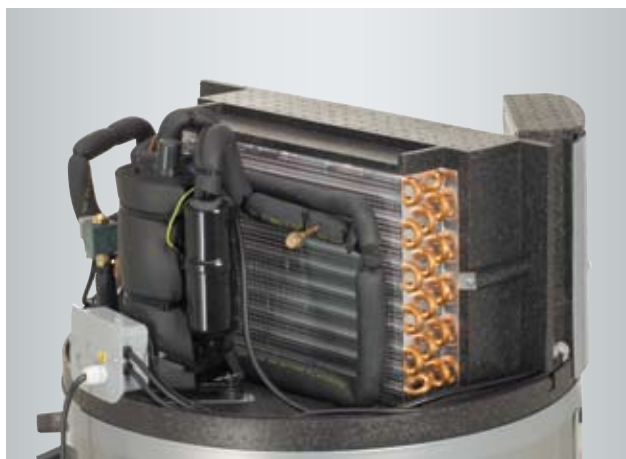
Bovenste gedeelte Vitocal 160 A

Via de zeer eenvoudig te bedienen regeling met groot display kunnen de verschillende programma's gemakkelijk ingesteld worden. Warmwaterbereiding, permanente werking of standby-werking – al deze functies kunnen geactiveerd worden met een beperkt aantal functietoetsen.